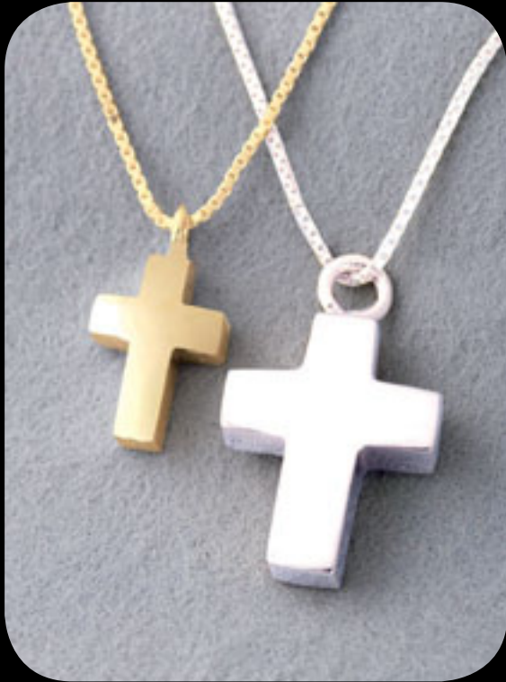
Silber klein: 31001 KZ · vergoldet klein 31002 KZ Silber groß: 30001 KZ · vergoldet groß: 30002 KZ 14 Karat Feingold (585): 31003 KZ