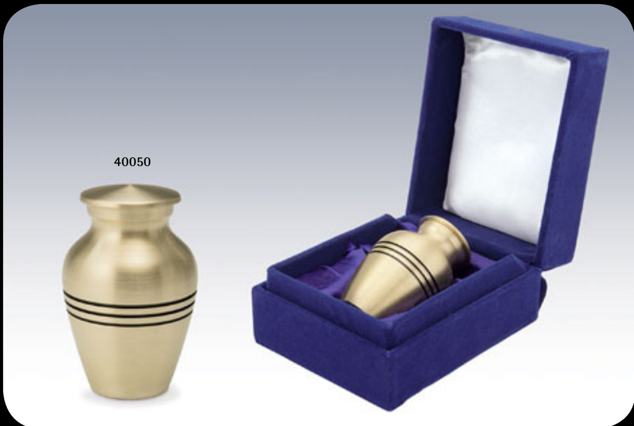
Micro-Urne aus Messing mit blauer Samtdose. Volumen 0,01 ltr.