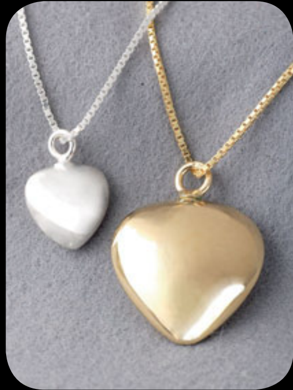
Silber klein: 31001 HZ · vergoldet klein 31002 HZ Silber groß: 30001 HZ · vergoldet groß: 30002 HZ 14 Karat Feingold (585): 31003 HZ