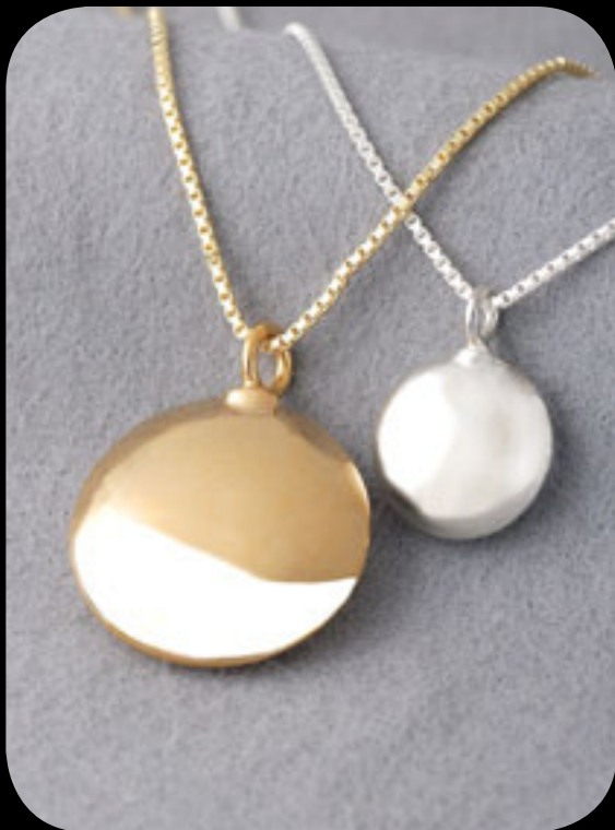
Silber klein: 31001 KS · vergoldet klein 31002 KS Silber groß: 30001 KS · vergoldet groß: 30002 KS 14 Karat Feingold (585): 31003 KS