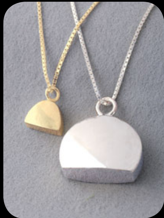
Silber klein: 31001 HS · vergoldet klein 31002 HS Silber groß: 30001 HS · vergoldet groß: 30002 HS 14 Karat Feingold (585): 31003 HS